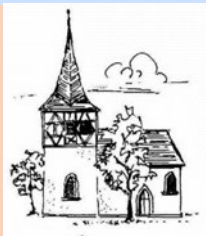
Marienkirche Kleinweisach Burgweisach, Dietersdorf, Dutendorf, Kienfeld, Oberwinterbach