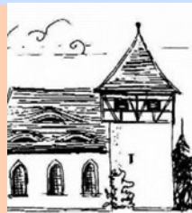
Katharinenkirche Pretzdorf Hombeer