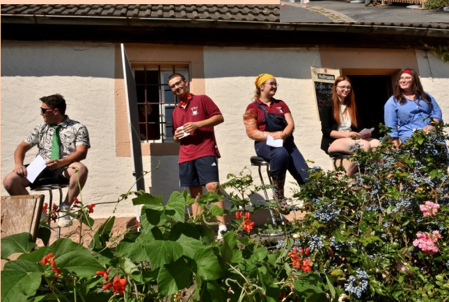
„Herzblatt“-Sketch vom Jugendclub